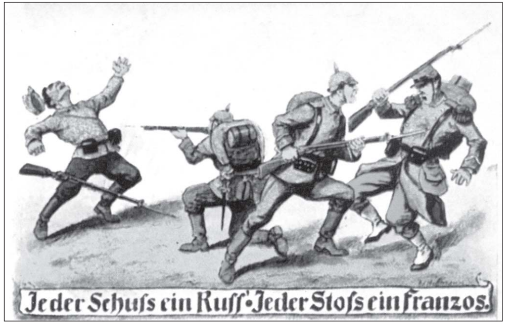
„Ropog a puska, hullik a muszka • Végre, francia a szuronyvégre”