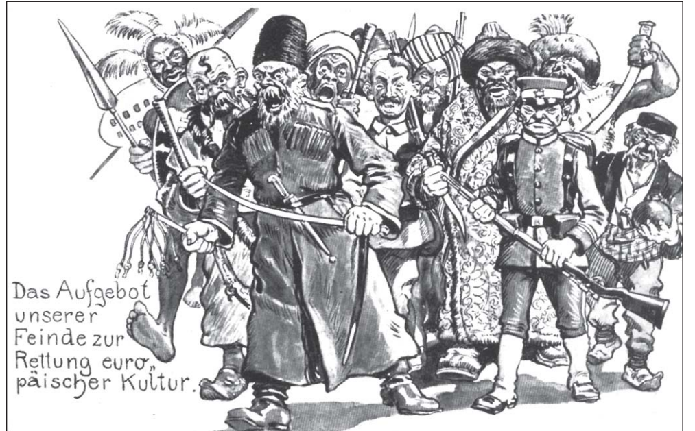
Ellenségeink mozgósítása az európai kultúra megmentésére

A Szlovákiában megválasztott 13 képviselőből mindössze Csáky Pál kapott bizottsági tisztséget. A szlovák politika ezt a helyzetet eléggé nehezen tudja megemészteni. Csákyt vádolni kezdték magyar elkötelezettsége miatt, és hogy nem képviseli a szlovák érdekeket, holott Szlovákiában került megválasztásra. Válaszában