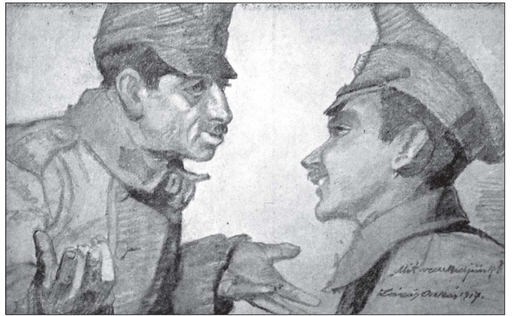
„Mit veszedjünk?” (1917)

Valaki vizet tölt a bádognakana fedelébe. Iszom, és csodák csodája, a víz nem meleg, mint várná az ember, hanem kellemesen hűvös és szomjoltó. Apám Borsod-Abaúj-Zemplén megye egyik piciny, határmenti falujából származott el a fővárosba. Míg a szülei éltek, gyakran jártunk haza hozzájuk. Emlékszem az elnyúló alakú, keskeny, alacsony házra, melyet egybeépítettek az istállóval, és melynek helyiségei földes padlójuk voltak. Nagymamám ha takarított, előbb nyírfaseprűvel felsöpörte a padlót, majd vizet hintett rá, hogy ne szálljon a por. Gondolatban megjelenik előttem a fehérre meszelt falú konyha, mely egyben egyik-másik családtagnak a hálója is volt. A keskeny faágy fölött szentkép díszelgett, a mestergerendán a férfiak a borotválkozó szerszámot tartották, s a kútra jártunk vízért. Az ablak szűk volt és kicsi, de a két ablakszárny között szoktam megtalálni hűsvétkor a nekem szánt hímes tojást. A nehéz, durva faasztal körül fapadok voltak, és egy öreg, felnyitható tejetű láda tele volt a Keresésben kalendárium régi számaival. És persze a kemence! Az volt ám a valami! Nagy, fehér búbja, ásitó fekete szája, gyerekként csodálkozásra készítetett, és némi tiszteletet is ébresztett bennem. Mi Pesten már akkor is villanytűzhelyt használtunk. És mi került elő a kemencéből? Hát kerék nagyságú, ropogóshéjú, foszlós belű kenyér. Amikor nagy-